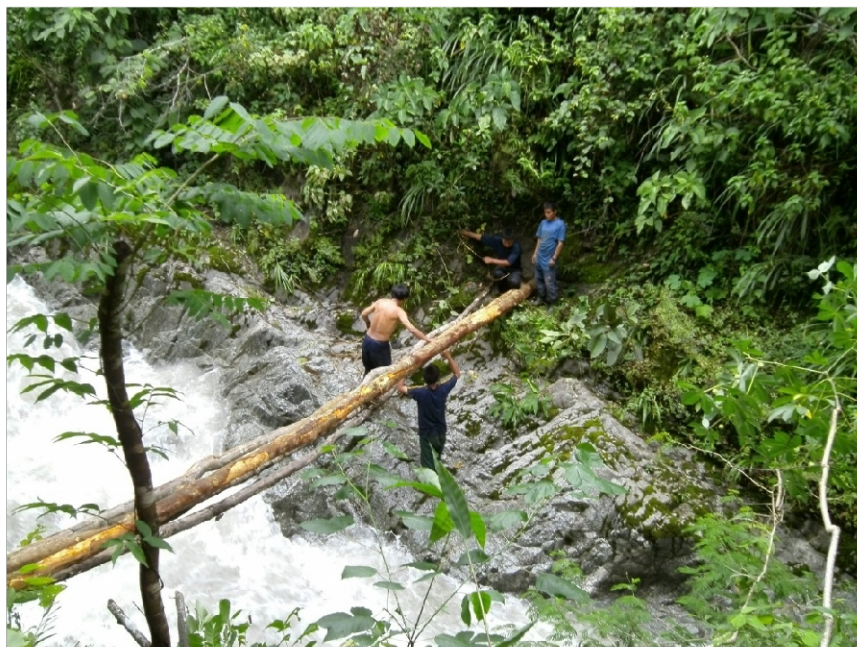
Combatientes del EPL. En una encañada, forzando el cruce del río Imaybamba. Agosto 2012.

¿Así las cosas, en qué quedó la denominada derrota de sendero, derrota del terrorismo, acuerdo de paz, la pacificación nacional y otras tantas diatribas? Creemos firmemente que todo esto es una infamia contra el Partido. Con fervor revolucionario desplegamos al viento las rojas banderas de la rebelión. ¡Viva la Guerra Popular! ¡La rebelión se justifica! ¡Tomar los cielos por asalto! Nuestra arma invencible: El Marxismo-Leninismo-Maoísmo, Pensamiento Gonzalo. Los reaccionarios dicen: Rinde tus armas . Nosotros le respondemos: Ven a tomarlas . Una vez más levantamos al tope la consigna del presidente Mao: Quien no teme morir cortado en mil pedazos se atreve a desmontar al emperador.