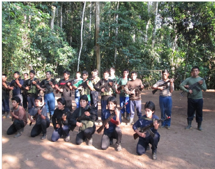
Destacamento del Ejército Popular de Liberación. Pampa Aurora, Huanta-Ayacucho. 2013.