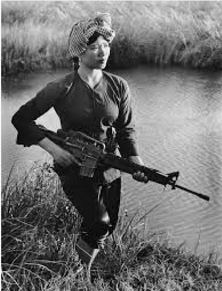
Combatiente del Vietcong. Vietnam 1969.