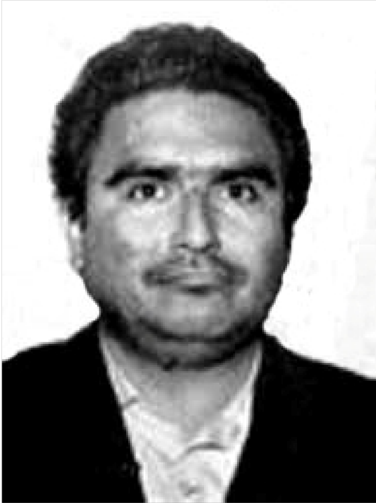
Dr. Abimael Guzmán Reinoso, Presidente Gonzalo. Jefe del Partido Comunista del Perú, Gran Marxista-Leninista-Maoísta, Pensamiento Gonzalo.