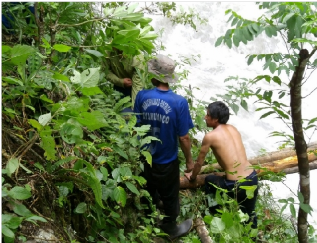
Combatientes del EPL, forzando el cruce del torrentoso río Imaybamba. Foto tomada el 13 de Febrero del 2011.

En lo que a nosotros respecta queremos reiterar, tantas veces sea necesario, para que quede nítido a través de la historia y para que los pueblos del mundo saquen lección de nuestros aciertos y errores. Es el Partido Comunista del Perú el que se ha atrevido a iniciar la guerra popular y ya estamos llevándola varios años adelante. El fundamento principal para sostener esta guerra es la ideología del proletariado, el Marxismo-Leninismo-Maoísmo, Pensamiento Gonzalo, invisible y todopoderosa. La línea política general y su centro, la línea militar proletaria. La teoría militar más alta del proletariado, la única verdadera manera de transformar la sociedad: la guerra popular. No hay otra forma. En la historia, en el desarrollo de la sociedad, los diferentes sistemas al caducar han dado paso a otra etapa más desarrollada. Sin embargo, otra vez cabe recalcar: no hay ningún precedente histórico en el cual, una clase cede el poder a otra y se retira benigneamente del escenario de la historia. Lo viejo, lo caduco, siempre se resiste a morir, de allí que, las transformaciones sólo se pueden realizar a través de la tormenta de la revolución.