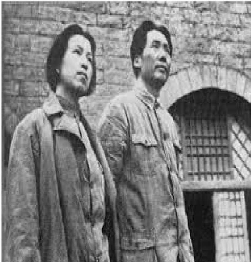
El presidente Mao Tse Tung y su esposa la camarada Chiang Ching, en la base de apoyo de Yenán.