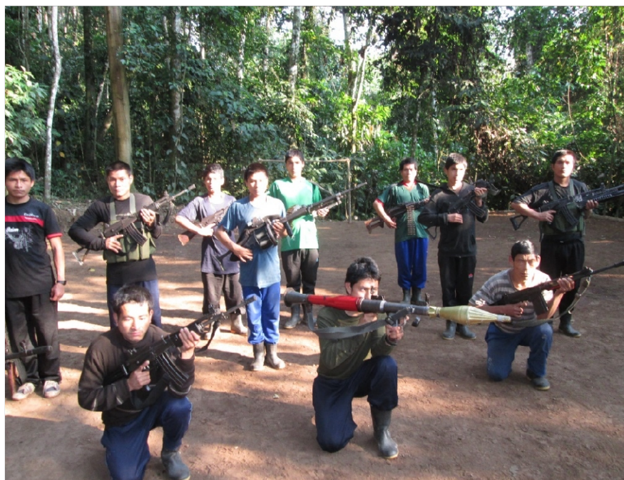
Combatientes del Ejército Popular de Liberación. En un lugar del Vizcatan. 2013.

se decide publicarla, pero, culpando de los muertos al Partido y exculpando a las fuerzas armadas y policiales del genocidio contra el pueblo peruano. Posteriormente esta misma Comisión lanza al viento el cuento de la reconciliación nacional al cual se suman los oportunistas y podridos revisionistas del movadef. Así las cosas, esta Comisión llamada de la verdad hiende a estado reaccionario del Perú y a imperialismo yanqui. Este organismo bastardo, instrumento del imperialismo norteamericano y del gobierno reaccionario del Perú llamado de la verdad, con el mayor cinismo y descaro ha trabajado para el gobierno reaccionario del Perú, en salvaguarda de los intereses de los explotadores y en detrimento del pueblo peruano.