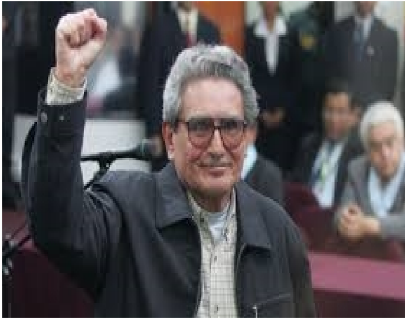
El Presidente Gonzalo, con puño en alto para el Proletariado Internacional.