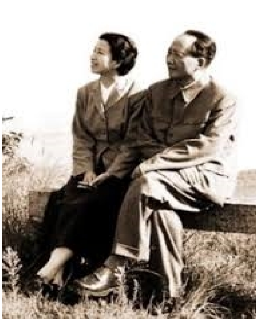
EL PRESIDENTE MAO TSE TUNG Y LA CAMARADA CHIANG CHING. ¡VIVA EL MAOISMO! ¡GLORIA Y HONOR A LOS HEROES DEL PUEBLO!