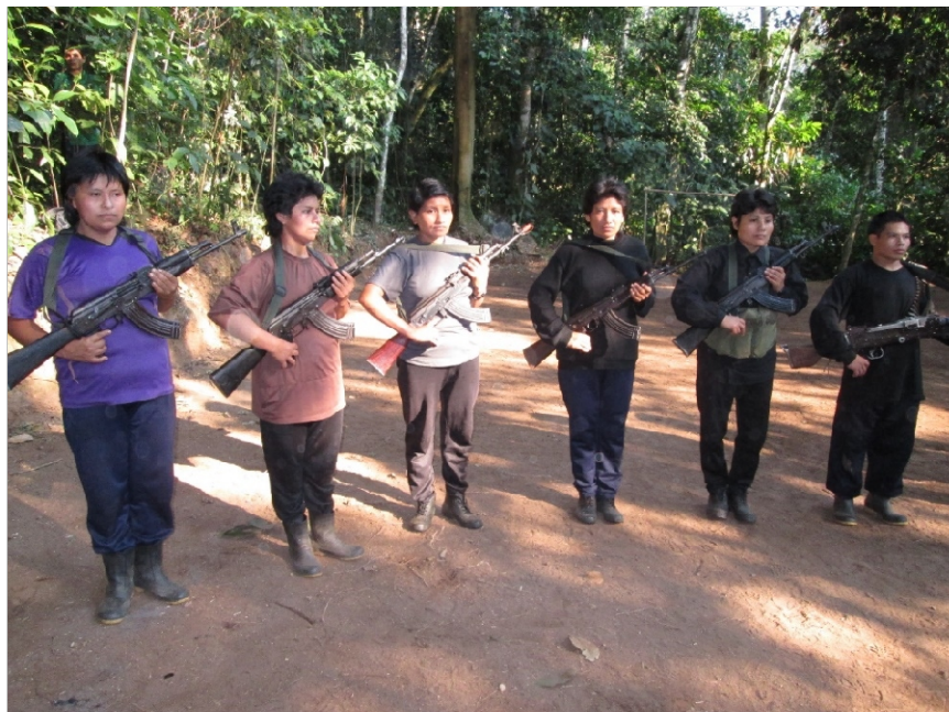
Las mujeres combatientes del Ejército Popular de Liberación. Partido Comunista del Perú.

...Antes de nuestra despedida que espero sea hasta muy pronta oportunidad, quisiéramos, darles a conocer, una vez más a todo el pueblo, los documentos partidarios de mucha importancia. Por falta de medios y otras condiciones, solo les proporcionamos una que es muy importante: las conclusiones del histórico Primer Congreso Marxista, Congreso Marxista- Leninista-Maoísta, Pensamiento Gonzalo. Se denomina: Documentos Fundamentales.