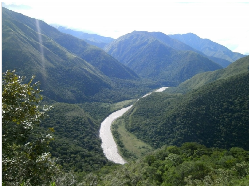
Vista panorámica del río Mantaro, desde las alturas de Matuspata o Ccompipata, parte del guerrero Vizcatan. Febrero del 2011, al norte de la provincia de Huanta, departamento de Ayacucho