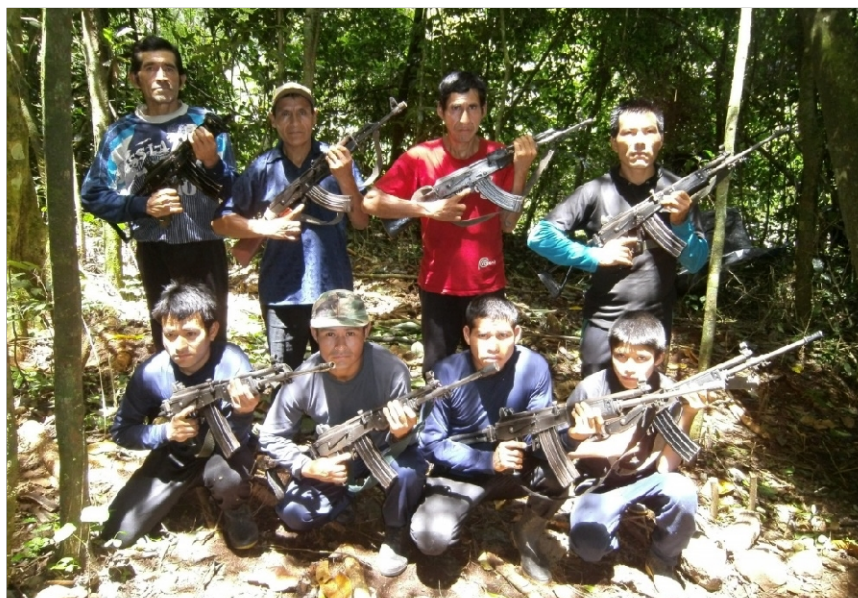
Combatientes del Ejército Popular de Liberación, en el sector denominado Churrubamba, Provincia de Huanta-Ayacucho. Febrero del 2012.

“Allá por el 68 nos decíamos: ¡todo se ha probado aquí, las elecciones, el rastrero electorerismo, hasta el cansancio, hasta el hastío! Hemos visto levantamientos ciudadanos que prueban que ese no es el camino; hemos visto –nos decíamos entonces– cómo el campesinado ha remecido muchas veces las entrañas mismas y profundas de esta patria, pero no habíamos probado el único camino, el verdadero, el camino de la guerra popular. Es ese camino el que nos atrevimos a asumirlo; entonces, éramos un puñado, comparado con hoy lo éramos, aunque fuimos quizá tanto número como los dedos de la mano los que persistimos en defender el Partido. Como el presidente nos dijo: “el problema no es cuantos son, el problema es ¿quieres o no?”. Y nosotros quisimos, queremos y querremos la guerra popular: de ahí nadie nos sacará, con el comenzó la toma del poder”. (Informe inaugural del Congreso a cargo del Presidente Gonzalo).