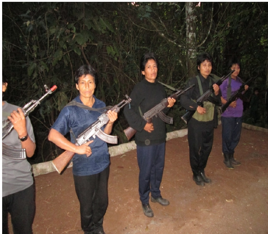
La mitad que sostienen el cielo. Combatientes del EPL. Pampa Aurora. Provincia de Huanta, Ayacucho. Setiembre del 2013.

¿En qué consiste la Solución Política a los Problemas derivados de la Guerra , por el cual tanto se desgañitan los oportunistas del movadef? En el mundo existen dos concepciones, dos formas de ver los problemas políticos, dos partes en contienda. El gobierno reaccionario del Perú, que representa a los grandes banqueros, los grandes terratenientes y la gran burguesía en sus dos facciones, compradora y burocrática, ellos detentan el poder y son la clase opresora; esto, por una parte. Y, por otra parte, el pueblo peruano: Obreros, campesinos, pequeña burguesía e incluso la burguesía nacional; ellos son la clase oprimida. Los opresores están sustentados por un poderoso ejército que es la columna vertebral de este estado.