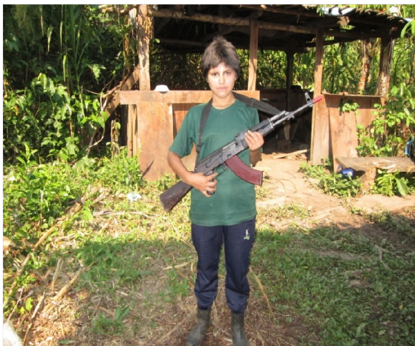
Combatiente del EPL, hija del pueblo, de la revolución y del Partido.

nunca se impondrá. Nuestra historia es esa, no tenemos otro camino: lucha, esfuerzo, tesón indoblegable, persistencia indeclinable y tiempo para que la práctica pruebe y sancione la verdad ". Todo lo nuevo se tiene que imponer en ardorosa brega, combatiendo a lo viejo que se resiste a morir, nada se nos ha dado a precio de ganga, todo lo hemos conquistado con esfuerzo, con nuestra sangre y con vidas luminosas que sin bacilar un instante han sido ofrendadas por el Partido y la revolución. Para eso hemos sido forjados como comunistas, con luz en la mente, acero en el pecho, espada en la mano y reto a la muerte. ¡Ojo! El que el Presidente Gonzalo haya sido detenido, el que esté en las garras y las mazmorras mas oscuras de este estado reaccionario no quita, en lo absoluto, la validez universal de la ideología del proletariado internacional, el Marxismo-Leninismo-Maoismo, Pensamiento Gonzalo.