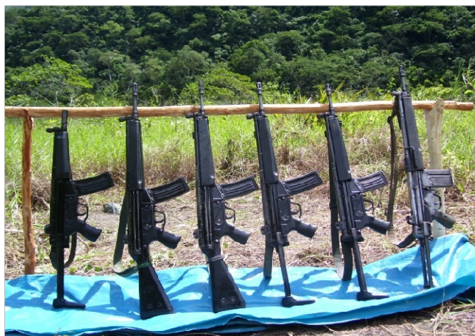
Emboscada a la DINANDRO de la PNP. Quinua-Ayacucho el 23 de marzo del 2008. 05 fusiles HK (G3), 01 MGL y abundante munición.