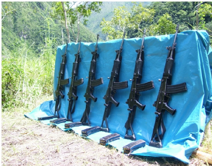
Emboscada a la fuerza armada en Matucana Alta, Sivia-Huanta-Ayacucho el 10 de Julio del 2003. Se confiscaron 06 fusiles Galil, 01 MGL, una pistola Pietro Bereta, una carabina calibre 9 mm.