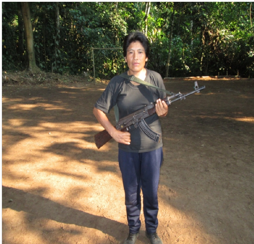
FOTO TOMADA EN SETIEMBRE DEL 2013. SECTOR DENOMINADO PAMPA AURORA, AL NORTE DE LA PROVINCIA DE HUANTA, EN EL LIMITE ENTRE HUANCVELICA, JUNIN Y AYACUCHO.